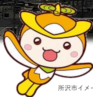
所沢市イメージマスコット