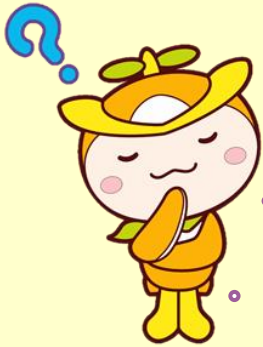
所沢市イメージマスコット トコロん