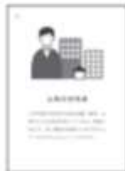
パートナーカード