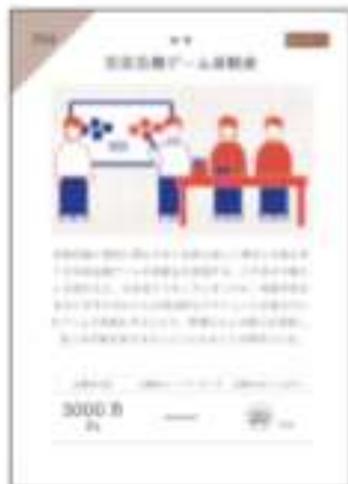
プロジェクトカード

「パートナーカード」と「お金」を集め、 プロジェクトを実施することで全体ゴールと個人ゴールを達成しよう！